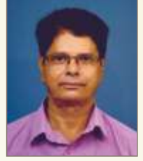
ಫ್ರಾನ್ಸಿಸ್ ಲೋಬೊ ಉಪಾಧ್ಯಕ್ಷ್