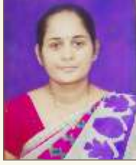
ಲವೀನ ಗ್ರೆಟ್ಟಿ ಡಿಸೋಜ ವಾರಾಡೊ ಕಾರ್ಯದರ್ಶಿ ಆನಿ ಕೇಂದ್ರಿಯ್ ಸಹಕಾರ್ಯದರ್ಶಿ